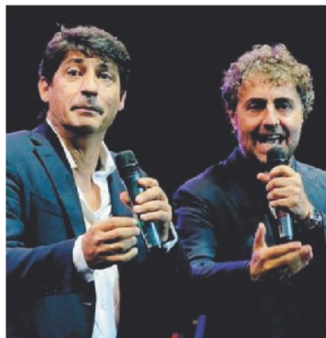
RISATE Toti e Tata

La Fondazione Megamark è la Onlus del Gruppo Megamark , tra le realtà leader della distribuzione moderna del Mezzogiorno con 45 anni di storia e oltre 500 negozi in Basilicata, Calabria, Campania, Molise e Puglia. La Fondazione sostiene e promuove iniziative e progetti con l'obiettivo di contribuire alla crescita culturale e sociale dei territori in cui opera. In Puglia promuove il bando 'Orizzonti solidali' rivolto al terzo settore pugliese e il premio letterario nazionale 'Premio Fondazione Megamark - Incontri di Dialoghi', nato per premiare il talento di scrittori esordienti e per contribuire alla diffusione della lettura nel Mezzogiorno.