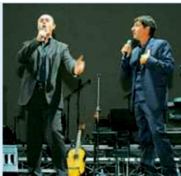
▲ Sul palco Solfrizzi e Stornaiole

Si terrà stasera, a partire dalle 18,30 al teatro Team di Bari, l'annuale serata di beneficenza organizzata dalla Fondazione Megamark onlus di Trani. L'evento, che va verso il sold out - pochissimi i posti ancora disponibili - sarà l'occasione per premiare i vincitori di Orizzonti solidali 2019, il bando di concorso rivolto al terzo settore pugliese promosso dalla Fondazione in collaborazione con i supermercati Dok , A&O , Famila e Iperfamila . Uno spettacolo ricco di emozioni e ospiti di eccezione, a partire dalla comicità di Emilio Solfrizzi e Antonio Stornaiole, il duo barese "Toti e Tata", fino alla musica dell'ospite a sorpresa, cantante di fama internazionale