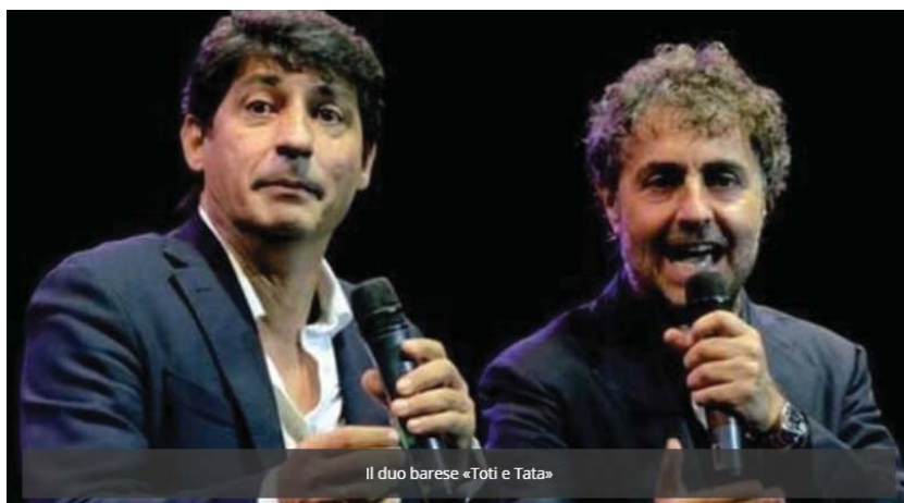
Il duo barese «Toti e Tata»

Domenica 9 febbraio 2020, a partire dalle ore 18.30 al TeatroTeam di Bari in via Giustina Rocca, si svolgerà l'annuale serata di beneficenza organizzata dalla Fondazione Megamark Onlus di Trani.